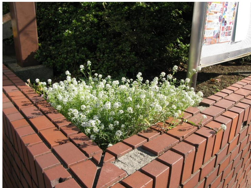
10/30 花がぶり返してきました。