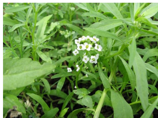
スイートアリッサム（1年草）