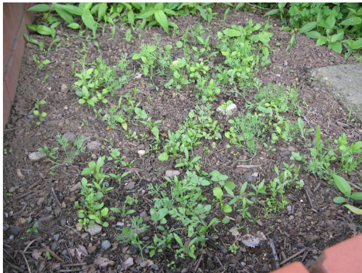
6/1 玄関脇（ミックスフラワー）